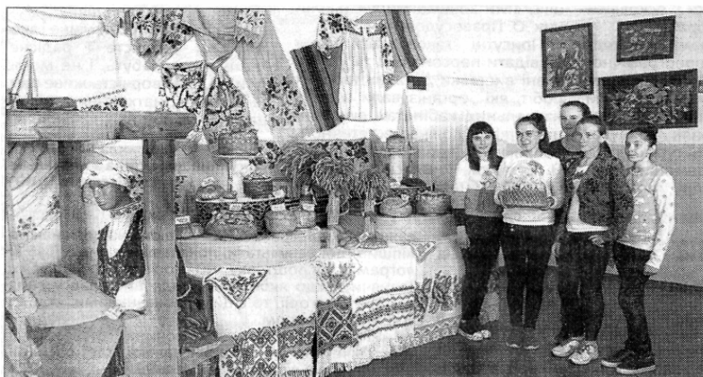
Група учнів Кам'янської ЗОШ оглядає експонати постійно діючої виставки хліба.