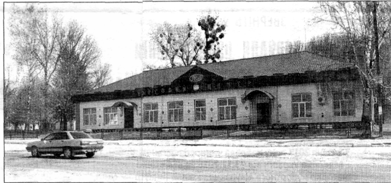
Торговий центр районного споживчого товариства.