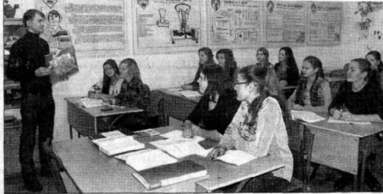
Наполегливо здобувають теоретичні знання майбутні продавці.

транспортних засобів категорії С-1, трактористів-машиністів сільськогосподарського виробництва категорії А-1, продавців продовольчих товарів, операторів комп'ютерного набору та швачок. Отож, отримавши свідоцтво про здобуття згадуваних професій, юнаки та дівчата після закінчення загальноосвітньої школи вже мають, так би мовити, «запасний аеродром». Адже не всім їм вдається з першої спроби вступити у вузи і за такої ситуації молоді люди можуть влаштуватися на роботу за отриманою спеціальністю. Нею можуть скористатися й ті, хто, отримавши вищу освіту, не може знайти робоче місце відповідно до здобутого диплома. Як стверджують працівники навчально-виробничого