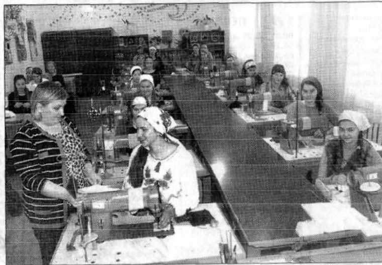
З цікавістю освоюють дівчата швейну справу.

господарствах, а швачки поповнюють колективи багатьох приватних швейних цехів та ателье, які відкрилися останнім часом в місті та селах, частина юних швачок продовжує удосконалювати свої знання у Березнівському ВПУ-4.