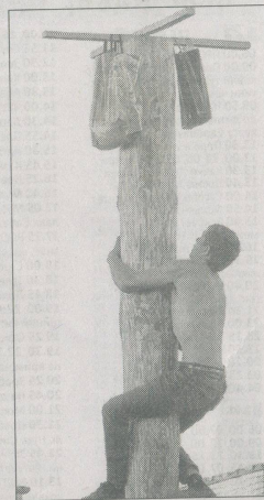
Знімання призів з 8-метрового стовпа.

флешмоб громадської органі- зації «Людвипіль», у якому взя- ли участь діти різних вікових ка- тегорій (хореограф-постановник Рицька Ю.). Піднесений настрої дарував усім концерт «Тобі, Укра- їно, наш любов і пісні». Загальну увагу привернула виставка на- родних виробів образотворчо- го та декоративно-прикладного мистецтва «Руками створена краса». Фотовиставка «Я люблю своє Соснове, я люблю свій рід- ний край» викликала у багатьох цікаві спогади та уявно поверта- ла у молоді літа. Була також чу- дова нагода поласувати смачним козяцьким кулішем, а до послуг дітей — різноманітні пересувні атракціони. Охочі до танцю відві- дали дискотеку.