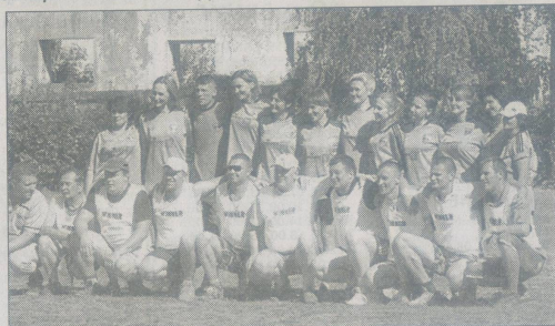
Футбольні команди «Цукерочки» та «Соколята».

ний край» викликала у багатьох цікаві спогади та уявно поверта- ла у молоді літа. Була також чу- дова нагода поласувати смачним козяцьким кулішем, а до послуг дітей — різноманітні пересувні атракціони. Охочі до танцю відві- дали дискотеку.