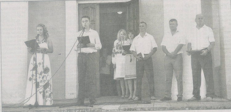
На сцені ведучі та гості свята.

28 серпня соснівчани відзна- чали велике християнське свя- то – Успіння Пресвятої Богоро- диці, 25-ту річницю Дня неза-