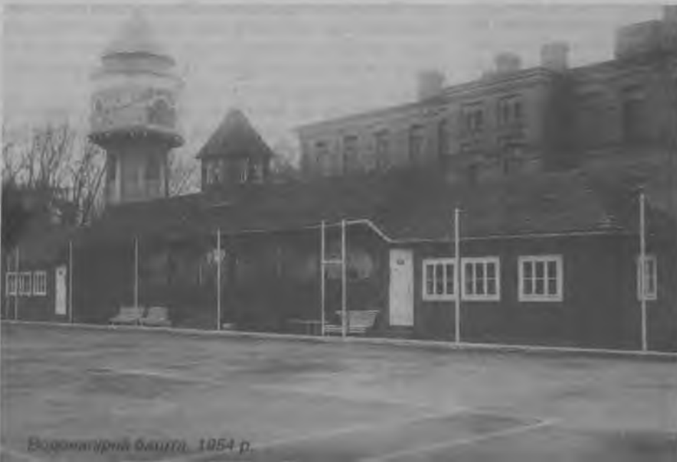
Водонапірні башта, 1954 р.

Міською каналізацією користувалася лише чверть населення міста. Більшість туалетів знаходилися на вулиці. Їх періодично чистили, викидали екскременти у річку чи на поля як добрива. Сміття збирали у ящиках, возили кіньми на міське звалище або закопували чи спалювали. Це негативно позначалося на санітарному стані міста, робили висновок американські аналітики.