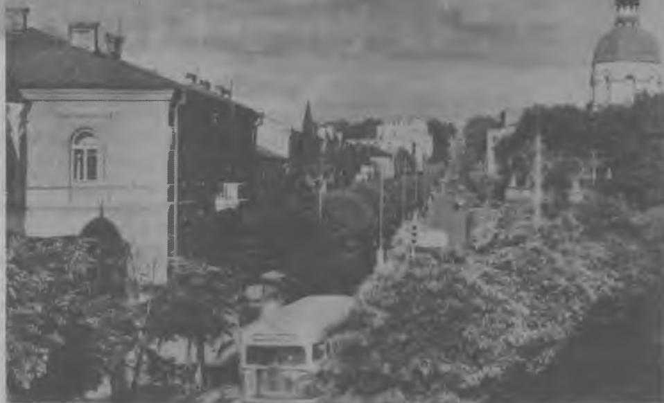
Вулиця Сталіна 1950-ті роки

Погані дороги, хабарі лікарям і спиртзавод у три зміни – так виглядає Рівне початку 50-х років минулого століття у звітах американських спецслужб