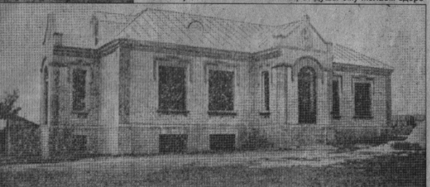
Новостроющаяся гостиница на Белевских хуторах.