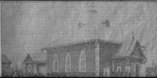
Белевская церковь во имя Б.М. «Взыскания погибших»