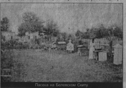
Пасека на Белевском Скиту