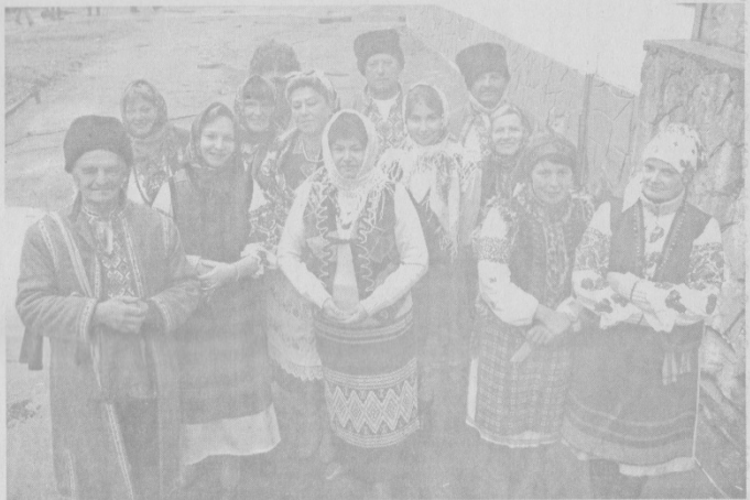
Василь ЛІСОВЕЦЬ Фото автора

Список сільгоспвиробників, переробних підприємств, фізичних осіб, які взяли участь у районному сільськогосподарському ярмарку в смт Квасилів 16 жовтня 2010 року: