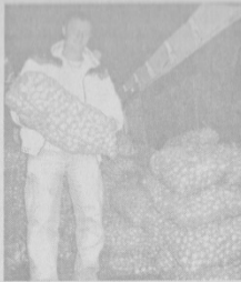
луні. А ще хочу купити мед. Ціни тут доступні для більшості квасилівців».

Гарною настрою покупців сприяло не тільки різноманіття продукції, а й музика та пісні у виконанні народного аматорського хору села Малий Шпаків та викладачі Квасилівської дитячої музичної школи.