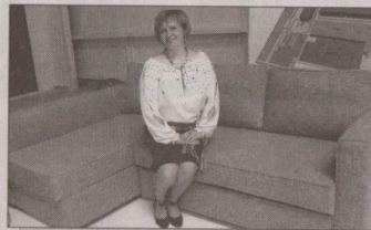
Одна з моделей м'яких меблів від «Морган Феніче».

— Те, що сталося у Квасилові, — сказав він, — що відбувається тут і буде відбуватися в подальшому, більш ніж приємно. Адже поліпшення інвестиційного клімату — це один із наших пріоритетів. Так само як створення нових робочих місць,