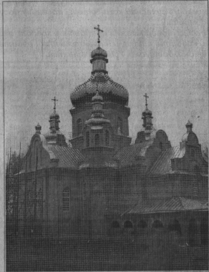
Доля самого барона склалася так, що «совєти» позбавили його найдорожчого – батьківщини, любові серцю Вишневої гори і Городка. Змущений був доживати своїх днів у вигнанні. Ірина Лукашівна розповідає, що у 1839 році придбали у барона Штейнгеля землі та майно. Тож його сім'я була змущена жити в домі своєї колишньої кухарки. Іночі 1910-х років вона кілька разів вийшла з будинку, щоб поглянути на свій дім.

Ірина Лукашівна, задулючі про барона і його родину, розповідає, що доля була не надто прихильною до нього. Перша його дружина померла при пологах, і він залишився з немовляти, первістком Борисом, абсолютно безпорадним. На допомогу йому приїздить його родичка, двоюрідна сестра Віра Миколаївна, яка замінювала Борисові матір. Серед архівних матеріалів вряже лист завісти барона таємно безпорадним (у 1810 році вона померла), проте спогади про неї у городоцьких селян залишилися найкращі. Це була чуйна, добра, великої душі людина, пораняння її пам'ятали. Баронеса Віра померла в Парижі та була похована в Києві на Аскольдовій могилі в родинному сімействі. У 1936 році «совєти» склеп підірвали. Цю звістку барон також дуже важко пережив. Третя дружина Штейнгеля, колишня гувернантка його дітей, за походження німкеня Олександра Вільгельмівна, на відміну від двох перших баронських дружин, не поділяла позиції щодо благонадійності, і було йому з нею незручно, хоч і прожили разом до кінця життя.