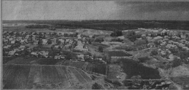
Панорама с. Зоря.

гектарів, сільський клуб (нині в сій будівлі Свято-Духівська церква с. Зоря – ред.). Після колгоспного господарства почали будуватися колгоспники. Так утворилося село Зоря. Свою назву одержало на прохання селищ-колгоспників і зв'язку з тим, що колгосп був передовий в районі та освітлював шлях до комунізму. У зв'язку з укрупненням колгоспів, було укрупнено і сільради, і у 1959 році указом Президії Верхов-