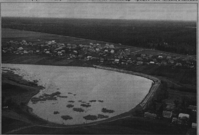
Дерев'янський став і село з висоти пташиного польоту.