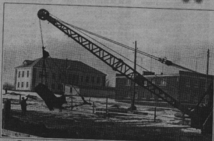
Будівництво «старого» торгового центру в селі Зоря на фоні першого двоповерхового будинку та будівлі правління колгоспу. Кінець 1960-х років.