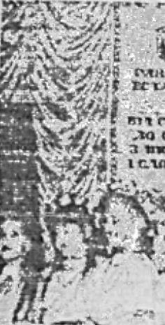
СМІЛИВА І ВІД СЕЛА ДО СЕЛА - З ПІСНЕЮ І СЛОВОМ

Хтось розминався старовинний оже, хтось - галлявчий верстат, а багато хто - тупитися біля «Лобі», відрукованої ще на початку мистецького свята, її принесла показати землякам Тамара Гивлігіва, щоб люди торкнулися душою Святого писма! Чотирнадцять майстринь демонстрували на виставках творчі декоративно-ужиткового мистецтва - гарного, шаманського, глибокого естетичного, самобутного, аматорського.