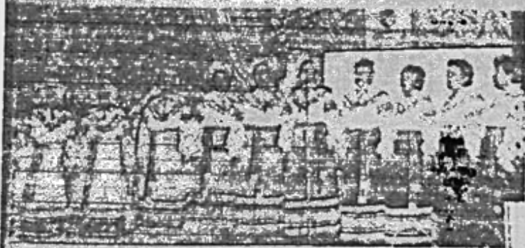
Районна мистецька естафета «ВІД СЕЛА ДО СЕЛА - З ПІСНЕЮ І СЛОВОМ» - здебільше творчність за своїм змістом, яка розкриває самодіяльність воляків, характерна потужним символічними виконавцями, відбулася 13 червня в Олександрії.