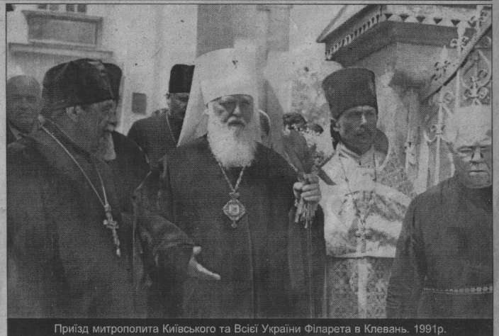
Приїзд митрополита Київського та Всієї України Філарета в Клевань. 1991р.

— Я народився в сім'ї, де і батько, і матір були глибоко віруючи-