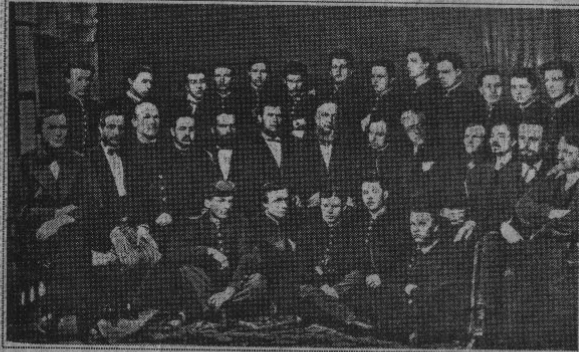
Випускники Рівненської гімназії. У верхньому ряді шостий зліва В. Короленко. Фото. 1871р.

Перша достовірна згадка про Рівне датована 1434 роком. Таким чином, офіційна історія нашого обласного центру сягає 573 роки, майже 6 століть. Але конкретні назви вулиць Рівного з'явилися на його планах починаючи лише з початку 19 століття. На цей час наш край входив вже до складу Російської Імперії. Назви вулиць могли вказувати напрями торговельних зв'язків з іншими містами (вул. Велика Мінська, сучасна Пересопницька), напрями основних шляхів сполучень з навколишньою округою (вул. Омелянівська, сучасна вулиця Шевченка), назви конкретних міських об'єктів (вул. Гимназійна, сучасна М. Драгоманова). Назви вулиць могли відтворювати етнічний склад міського населення (вул. Німецька, сучасна Гетьмана Мазепи), побут рівнян (вул. Торгова, сучасна Базарна), їхні професійні заняття (вул. Милитарна, сучасна П. Калнишевська).