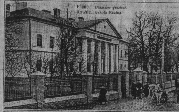
Рівненське реальне училище. Пошта. Поч. XX ст.

Земельна ділянка, на якій розмістилася гімназія, складала понад 2 гектари. Окрім головного корпусу тут були споруджені ще 2 цегляні будинки, 2 дерев'яні флігелі, декілька сараїв. У цегляних будинках були квартири для вчителів, а в дерев'яних флігелях — хімічна лабораторія і квартири для обслуговуючого персоналу гімназії. У самій же гімназії облаштували до десятка навчальних класів, фізичний кабінет і бібліотеку. Фундаментальна частина бібліотеки нараховувала майже 6 тисяч назв і понад 13 тисяч томів, навчальна література складала понад 4 тисячі примірників. Це була одна з кращих