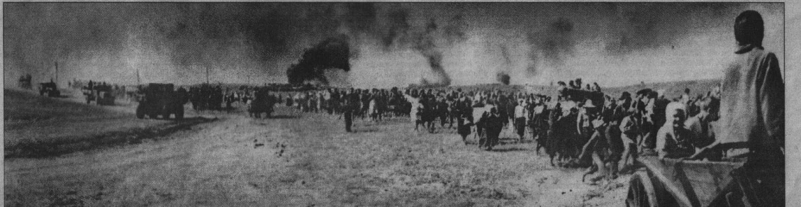
Дю грудня 1941 року від частин і з'єднань першого ешелону, що прийняли на себе удар 22 червня, залишилися до восьми відсотків особового складу. По-суті, з агресором воювала вже нова по складу армія. По кількісним показникам нашої армії на 22 червня 1941 року не було рівних у світі. Тільки по танках і літаках ми переважали збройні сили Німеччини і її союзників (Японії, Італії, Румунії, Угорщини, Фінляндії) разом взятих у два рази по артилерії. Але при такій силі військової техніки, не вистачало засобів її обслуговування і ремонту: автомобілів для доставки пального, боєприпасів, запасних частин, механічної тяги (тракторів), радіозасобів, інженерних озброєнь.

На початку війни наші танкові з'єднання, без прикриття авіації, вели важкі бої в районі Дубно. У танкістів майже повністю була відсутня взаємодія з піхотою і артилерією. Катастрофічно не вистачало пального. Битва була програна.