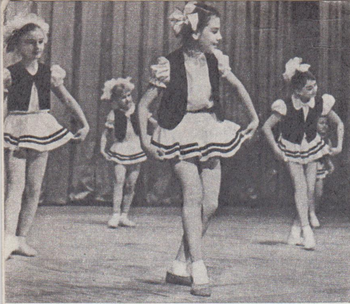
Танцюють учениці хореографічного відділення.

навчально-виховний процес, і колгосп забезпечив нас ними. Ніби все приведено до одного знаменника. І які спеціальності викладатимуться, і де розмістяться музиканти, й де художники. Та зненацька знов проблема. Де на перших порах дітям узяти скрипки, бандури, акордеони, баяни, щоб готуватися вдома? Навіть скрипочку малюкові не просто підібрати, обов'язково потрібна порада фахівця, вчителя.