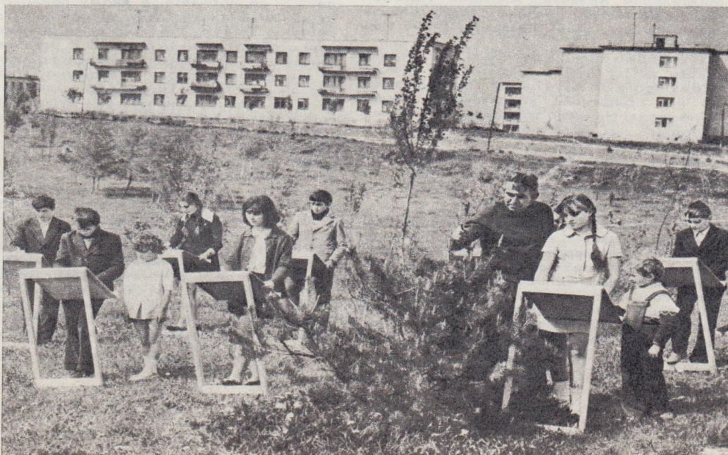
На етюдах юні художники.

Репортаж із Зорянської державної експериментальної школи мистецтв