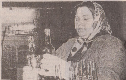
Браку практично немає.

скляного посуду в Канаді, єдиної в Північній Америці компанії, яка отримала сертифікат якості 1509001 за стандартами склотар, у плані ефективності - наші найкращі. Бажаючи оглянути його захоплено роззираються у велетенському цеху, автоматизованому до такої міри, що він здається майже безлюдним, а до функцій робітників входить гетьовно контроль за роботою механізмів та спостереження за екранами комп'ютерів, на яких подається повна картина технологічного процесу. Найяскравішою його точкою у буквальному розумінні є