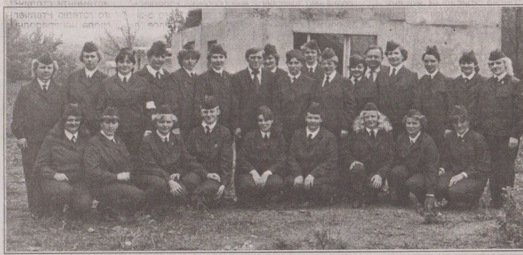
Сандружина колгоспу «Зоря комунізму» на районних змаганнях санітарних дружин. 1985р.

важливі органи (не тільки бюро і комітети). Який ще період вашого життя може зрівнятися з тим, комсомольським? З тими роками врівнючої енергії, відчуття свого безсмертя й безодні першого кохання? Як би там не було, але комсомол для багатьох не став трясвиною, що засмоктувала благородні приви юних душ. В їх хаос він безумовно вносило так зване організуюче начало, яке до всього для багатьох дало змогу реалізувати свої здібності лідерів. Не дарма у 90-х роках, в числі найбільш успішних підприємців було немало колишніх комсомольських ватажків. Це ж саме стосується і політиків. Багато хто з них перші свої публічні промови виголошували саме на комсомольських зборах. А іншої нагоди «поцицеронитись» просто не існувало. Зате тепер існує повний плюралізм. І такі гранди комсомолу України як колишній перший секретар його ЦК Анатолій Матвієнко чи перший комсомолець Дніпропетровської області Сергій Тигілко, або інший дніпропетровський комсомольський гранд Олександр Турчинов перетворилися в зірки вітчизняного політикуму, що на його небосхилі час від часу спалахують. Причому на різних ідеологічних платформах. Отож, ніколи не слухайте суб'єктів, які говорять штампами, мовляв, комсомол – це прихвостень КПРС. За цією логікою три чверті українського парламенту – колишні прихвостні компартії. Однак їхня присутність у Верховній Раді свідчить про одне: комсомол їх дечому навчив. Отож не варто