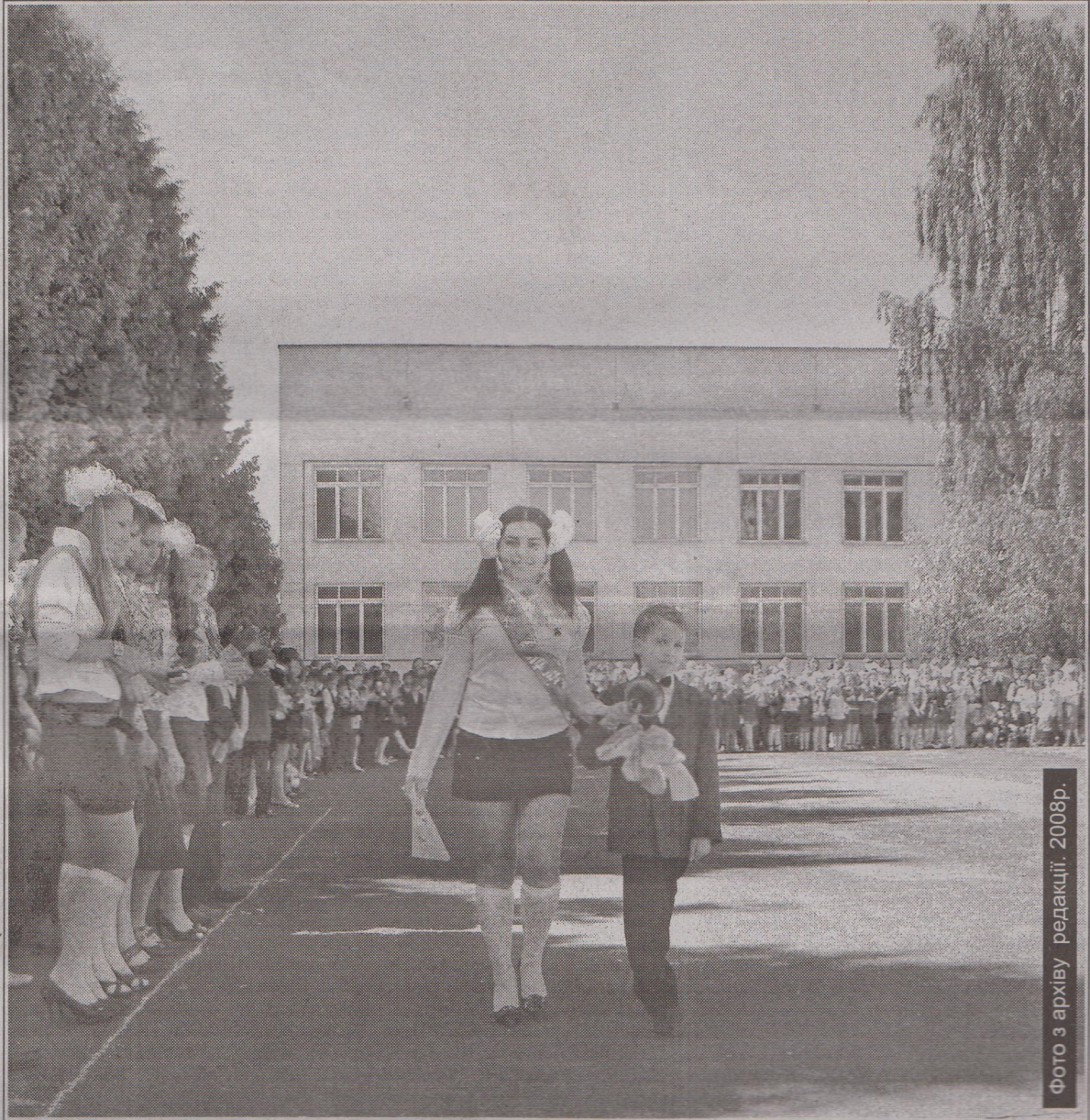
Фото з архіву редакції. 2008р.

5 лютого випускники різних років шкіл Клеванищини зберуться на свої традиційні зустрічі. Які емоції переповнюють сучасника, що закінчив школу двадцять і десять років тому – читайте на 3 сторінці.