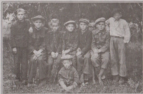
Кобилянські дітлахи. Повоєнні роки.

Але повернемося до наших Кобилиць. Яким було хуторське життя? Та як на хуторі. Але виявляється, кобиляни були великими приборчниками громадських заходів. Сповідували активну життєву позицію.