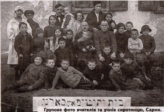
Групове фото вчителів та учнів сиротинцю, Сарни.

Колони червоноармійців справляли гнітюче враження. Вояки були неохайно вдягнені та виглядали виснаженими. До місцевого населення старалися не наближатися, на спроби спілкування деяких людей відгукувалися неохоче. Протягом декількох днів біжці Червоної Армії проходили через місто Сарни, відпочиваючи протягом кількох годин. Деякі з офіцерів зупинялися біля місцевих жителів, розпочинаючи дружні бесіди. Вони намагалися заспокоїти населення і обіцяли, що Радянський Союз — це Едемський сад для всіх народів. Радикальному зберігати спокій і щоб кожен повертався до своєї роботи. Говорили людям, що у Радянському Союзі немає нічого поганого, і Червона Армія, і Конституція Сталіна будуть захищати їх завжди. Слова в цьому дусі були також чути на всіх зборах, які влаштовували в усіх частинах міста. У скорому часі вийшла директива нового очільника Сарн Х. Ненюка про передачу всього майна єврейської громади в руки міста. Багатом торговцям, купцям, власникам крамничок у Сарнах загрожувало банкрутство. До того ж у місто наїхало різних людей із Радянської Росії, котрих відразу ж працевлаштували, тому багато містян втратили роботу. Закрили єврейські школи Тарбут і Талмуд-Тора, і, як наслідок, звільнили їх учителів. Незабаром єврейські школи відкрили й на місці звільнених єврейських учителів взяли новоприбулих. Але однак вони не змогли працювати, тому що вивчення івриту стало немислимим, а педагогі не були готові викладати ідиш у радянському стилі.