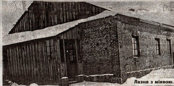
Лазня з міквою.

території рейхскомісаріату України», все єврейське населення взяли на облік. На стінах будинків з'явилися оголошення: «Всі жиди міста Сарни та його околиць повинні з'явитися в понеділок, 29 серпня 1941 року, до 8 год. ранку на площу біля костюлу. Узяти з собою документи, гроші, а також теплий одяг, білизну та ін. Хто з жидів не виконає цього та буде знайдений у іншому місці — буде розстріляний». Хтось ховався по підвалах, хтось тікав до сіл, а інші пекли