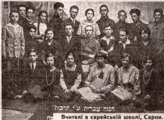
Вчителі в єврейській школі, Сарни.