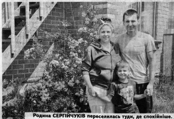
Родина СЕРГІЙЧУКІВ переселилась туди, де спокійніше.