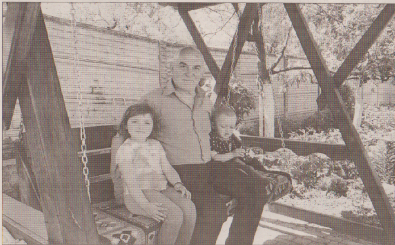
Горнуться до дідуся онуки, довіряють йому свої секрети.