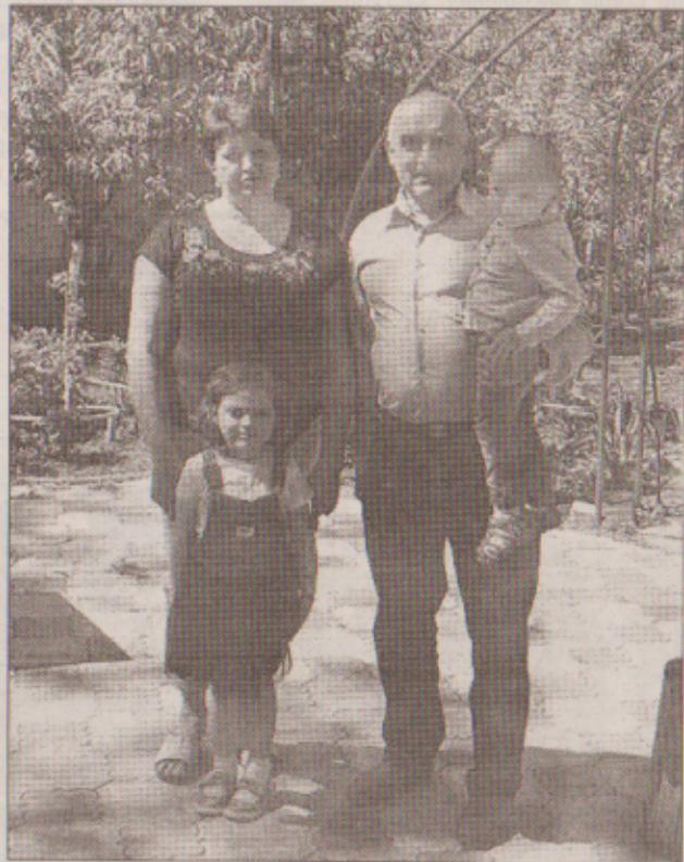
З дружиною й онуками.