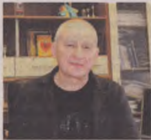
З вітаннями та подарун-

Від гімназії Товариства батьків Рівного до навчально-виховного комплексу Школа-Ліцей №2 минуло довгих сто років. Та як би віхи історії не змінювали адресу місцезнаходження навчальних корпусів та назву освітнього закладу, незмінним залишалася мета, якій служили педагоги – сіяти в дитячих душах мудре, вічне, розумне. Отримавши ґрунтовні знання, десятки тисяч випускників впевнено знаходили свою життєву стежку, а згодом професійними здобутками до нових звершень окриляли і вчителів, і учнів.