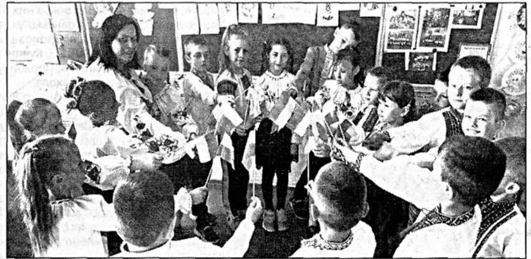
Ми любимо Україну.

За словами керівника ліцею, школа – це не тільки стіни і дах. Перш за все, це люди: ті, хто може навчати, і ті, хто прагне