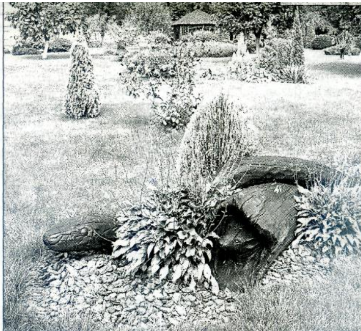
Мальовничі куточки на території лісгоспу.

Характерно те, що на підприємстві продовжують будівництво доріг з твердим покриттям, удосконалюють маршрути, утримують в належному стані лісотранспортні мережі. Це дає можливість збільшити статна-