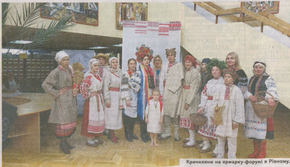
Кричильяни на ярмарку-форумі в Рівному.