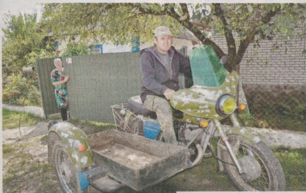
Осінні клопоти Леончиків.

Село Довге разом із Тутовичами та селищем Чемерне нині належить до Тутовичького старостицького округу Сарненської територіальної громади. При в'їзді (й не тільки) привертають увагу сучасні європейські будинки з фасадами, побудовані за індивідуальними проєктами. Чого не можна сказати про дорогу. Громадські активісти неодноразово піднімали питання про облаштування узбіччя, особливо дороги, що веде до церкви та кладовища. Адже багато селян дістаються туди велосипедами. А живуть у селі трудолюбиві та працьовиті люди. Тож у будні дні на вулицях майже нікого не знайти. Пора грибів, картоплі й малини. А от чим заможніші жителі населеного пункту, тим менше хочуть із кимось спілкуватися, особливо газетярами.