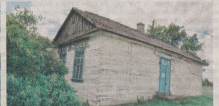
Місцевий магазин відкривається тричі на тиждень.

- Якщо вони перестануть кусати, то ми почнемо хвилюватися, – сміється чоловік.