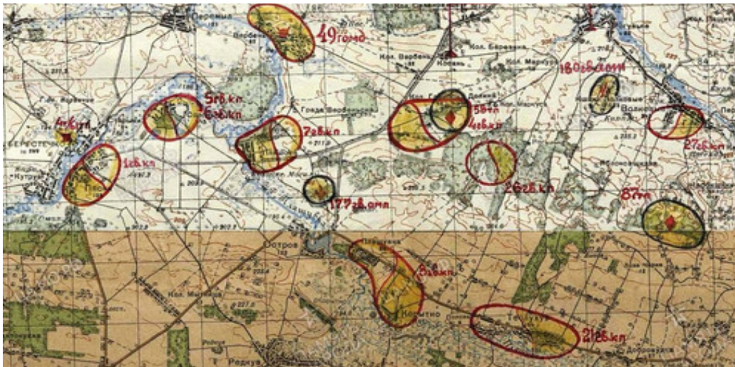
Фрагмент звітної карти розміщення частин 1-го гвардійського кавалерійського корпусу в період з 1 по 31 травня 1944 року ( https://pamyat-naroda.ru/documents/view/?id=111895872 )