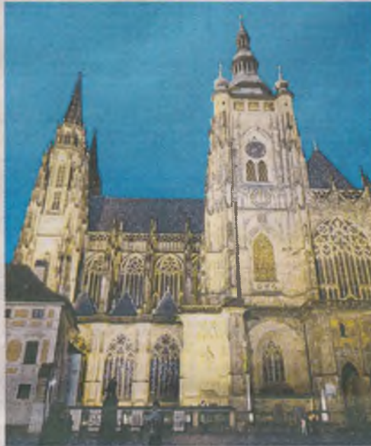
Щоб сфотографувати собор святого Віта, довелося стояти перед ним на колінах.