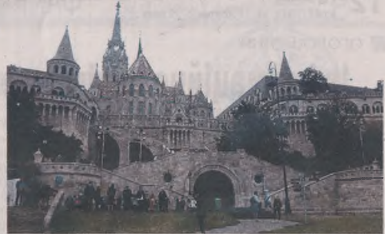
Рибальський бастион – одна з наймолодших пам'яток Будапешта на Дунаї.

Панелька старого зразка, але на першому поверсі не квартири, а гаражі... Так само, як і у нас, старі багатопверхівки утеплюють, тому інколи не зрозуміло, новий то будинок чи старий.