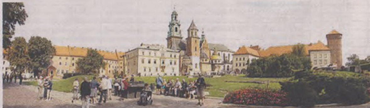
У королівській Вавель хочуть потрапити усі, хто приїжджає до Кракова. Навіть ті, кому важко вимовити його назву.