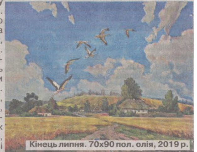
Кінець липня. 70x90 пол. олія, 2019 р.

Розмова з Петром Петровичем – то справжнє свято для душі. Дослухаєшся до розповіді художника і губиш відлік часу. Бо цікаво все – і світ його дитинства на околицях Борового, і перші