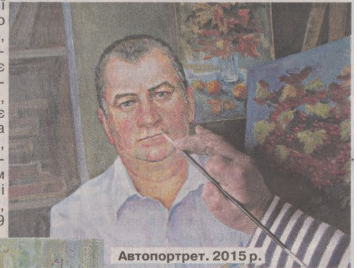
Автопортрет. 2015 р.

Март, вихідці з рідної Зарічненщини. Знаєте, я коли буваю у Зарічному, не чекаю автобуса, йду пішки. Бо вельми хочеться дістатись до могутніх дубів у Річиці, обійняти їх, набратись від них сили. А які хатки дерев'яні в Перекаллі! Дивовижна краса, на них бурштинова смола повиступала. Отаку красу на полотно. Або ж криничні перекальські журавлі. Або ж Нобель наш взяти – отам рай для художника! Серце щемить, коли