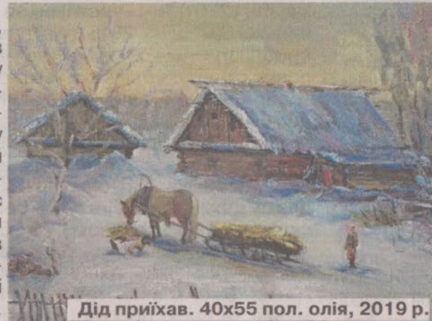
Дід приїхав. 40x55 пол. олія, 2019 р.

чоловік в літах: «Етюд пишете?» «А ви звідки знаєте, що то етюд?» «Бо я - художник.» Яким здивуванням для мене стало, коли дізнався, що ми земляки. Мій новий знайомий народився в ... Перекаллі. Коли він назвав це село, я сам уже здогадався, що переді мною Анатолій Март. Я давно мріяв отримати від цього художника майстер-клас. Приїздив він потім до мене в гості. Гарну оцінку моїм роботам дав. От, який тісний світ! Приємно знати, що такі талановиті люди як Анатолій Март, вихідці з рідної Зарішчани.