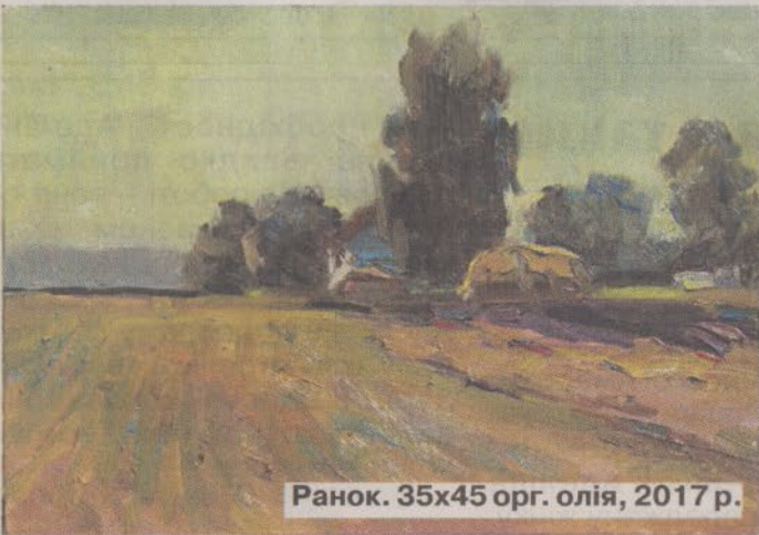
Ранок. 35x45 орг. олія, 2017 р.

кроки в самостійне життя, його сіра проза і поміж нею – неймовірне бажання творчості. Причастився ним малий Петро, споглядаючи роботу борівського художника Євстафія Поляка. А коли отримав від свого першого наставника по класу живопису у подарунок справжні олійні фарби – щастю хлопця не було меж. Ніяк не міг натішитися їх запахом, вважав