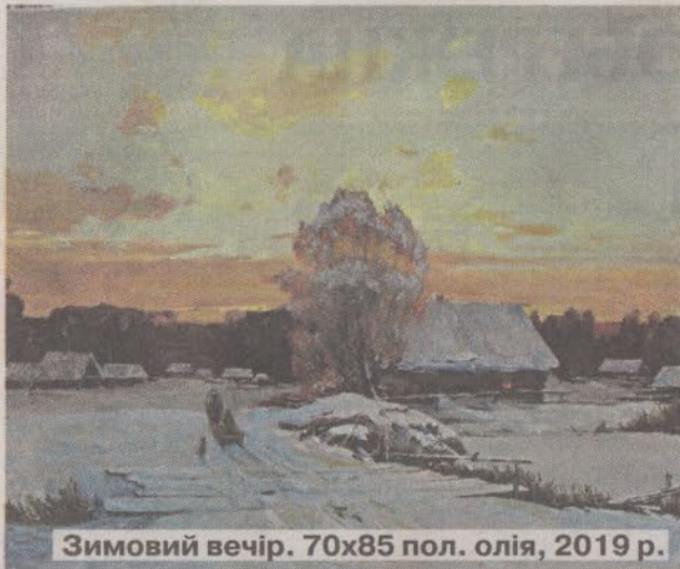
Зимовий вечір. 70x85 пол. олія, 2019 р.

себе в ту мить володарем найціннішого скарбу на світі.