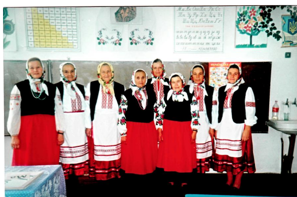
Народний аматорський фольклорний гурт с.Залав'я