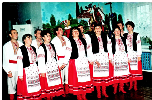
Фольклорний аматорський колектив вчителів Блажівської ЗОШ І-ІІІ ст. «Полісяночка»