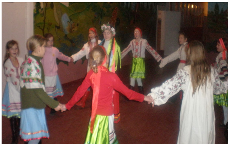
Інценізація свята Івана Купала учнями молодших класів Блажівської ЗОШ І-ІІІ ст..

Віночок з квітів і трав – найголовніший атрибут святкування свята Івана Купала.