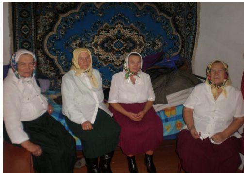
Місцеві старожили за виконанням купальських пісень і розповіді про це свято