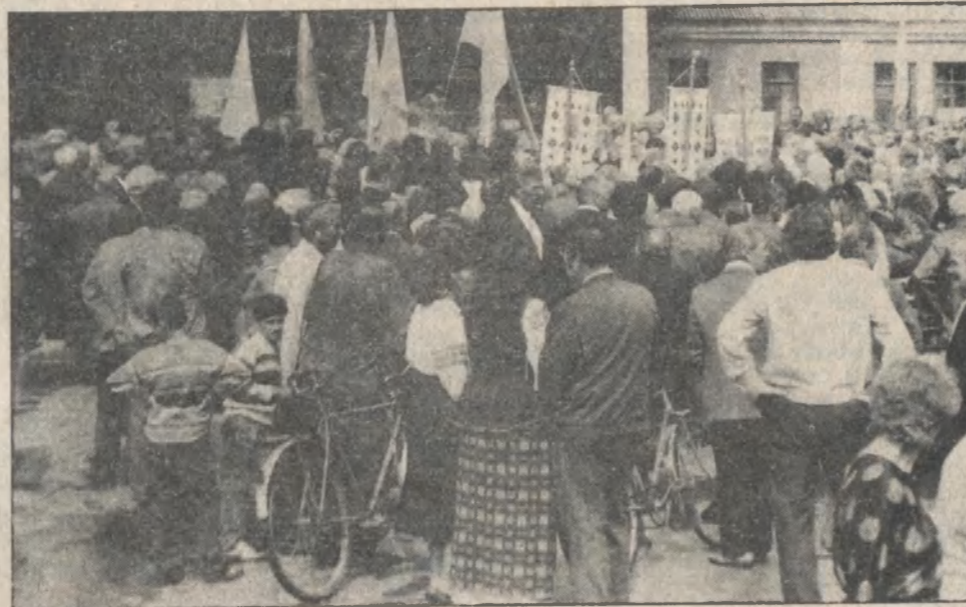
Молебень на площі біля автостанції.