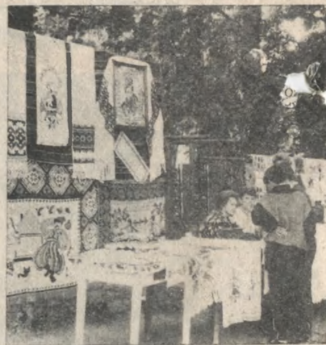
Виставка робіт народних умільців.