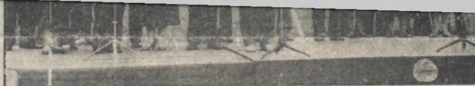
Керівники району і гості міста під час святкового мітингу.