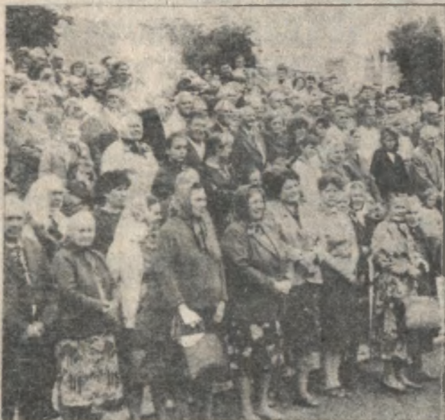
Великороддя на стадіоні.