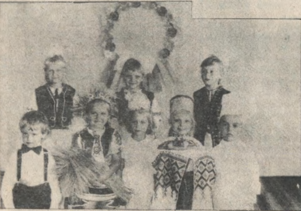
Свято у дитсадку «Світлячок».

що спіткало її на цьому шляху, поборницею православ'я і своєї рідної української церкви. З українського православ'я вийшло багато достойників на ниві духовного становлення нашої нації, які служили Богові і народові, ділили з ним радість і смуток, благословляли на подвиги за честь і волю рідної землі.