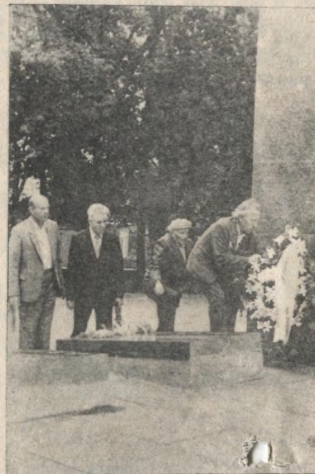
Вінки — на могили полеглих за свободу України. Квіти та вінки в день свята було покладено і на могили в Гурбах та інших населених пунктах району.

Варто відзначити самодіяльних митців із Будинку культури цементників, Здовбиці, Нової Мощаниці, Ступно, районного Будинку культури. Адже у їх виконанні майстерно прозвучало ряд творів про Україну, її мову і співучий