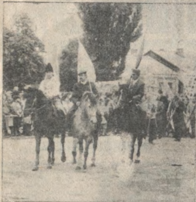
Попереду — прапори.