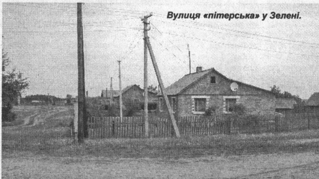
Вулиця «пітерська» у Зелені.

Парадокс, але в цьому заповіднику прадавньої загальноукраїнської культури чи не найгостріше стоїть проблема... із сільським клубом. Адже місцевий клуб побудований ще у 1958 році із цегли, що залишилася від розібраної церкви, й нині зовсім не задовольняє потреби сучасних Сварицевич. Тож, буває, на свята стільки набивається людей, що й повернутися важко. Тому зазвичай, загальновідомий фестиваль «Водіння Куста» проводять біля іншого сільського осередку культури - кафе-бару «Волна». Цю російськомовну назву закладу, як і його сам, подарував односельцям відомий на тепер московський бізнесмен котрий зріс у простій сварицевичській родині. Свого часу відкриття цього бару перетворилося на справжнє шоу, участь в якому взяли дві відомі московські шоу-групи. Тож попри віддаленість, не така вже Сварицевичі й глибинка. Своєрідна поліська місцина, що живучи за законами пращурів, щодень далі крокує в Європу, створюючи достаток своїми руками на власному обійсті.